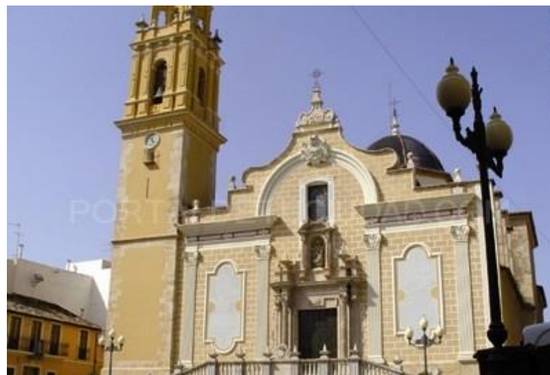
Parroquia Ntra. Sra. de la Asunción. Benaguacil.

Ministro de la Zona Valenciana de la OFS