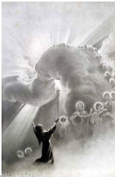
J. Segrelles: ...y Dios le mostró una visión maravillosa...