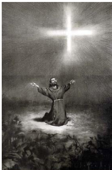
J. Segrelles: ...y en este sitio se puso a orar...

El primero contestó: –“Eso es un absurdo. Caminar es imposible. Y ¿comer con la boca? ¡Ridículo! El cordón umbilical nos nutre y nos da todo lo demás que necesitamos. El cordón umbilical es demasiado corto. La vida después del parto es imposible ”. El segundo insistió: –“Bueno, yo pienso que hay algo y tal vez sea diferente de lo que hay aquí. Tal vez ya no necesitamos de este tubo físico”.