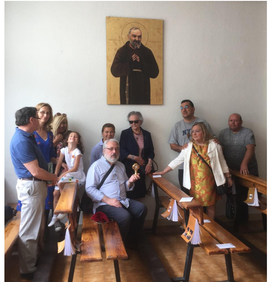
Última Misa de Regla del Curso Pasado. La Fraternidad bajó la protección del Padre Pío.

Aprovechando este comentario, me gustaría que nos fijáramos en estas próximas fechas, en las que para esta gran familia significan tanto. El Tránsito de nuestro Padre San Francisco y el día siguiente debe de significar algo tan grande que nos deba llevar a reflexionar sobre nuestra propia vocación. Ser franciscano significa amar a Cristo con todas nuestras fuerzas tal y como lo hizo San Francisco. Y este amor nos tiene que llevar a vivir o al menos acercarnos a la forma de vida que tuvo San Francisco, viendo en el hermano el rostro de Cristo, viendo en todas las criaturas la gran belleza y bondad de Dios. Así lo hizo San Francisco. Pero esto no se puede conseguir, como he dicho anteriormente, sin una verdadera contemplación del Evangelio y, así, saber llegar a conocer la voluntad de Dios y los misterios que encierra la Sagrada Escritura. Que belleza, que paz tan grande se siente en una verdadera contemplación.