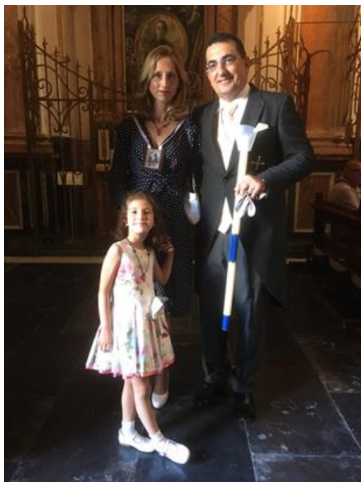
Representantes de la Fraternidad de San Francisco de Asis en la Procesión del Corpus.

Os invito, queridos hermanos, a que vivamos estos días tan grandes con la máxima devoción, con ilusión, con agradecimiento por el don tan grande que Dios nos ha dado, es decir, nuestra vocación franciscana. Estemos siempre dispuestos a servir a Dios en nuestras fraternidades, en todo aquello que se nos pida, porque servir a nuestras fraternidades es servir al hermano y servir al hermano es servir a Dios.